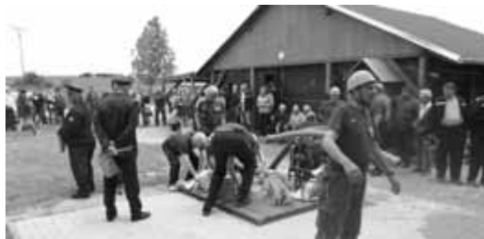
Živé Mysletice. Děti u kamenné hospodyně, hasiči ve svém moderním areálu.