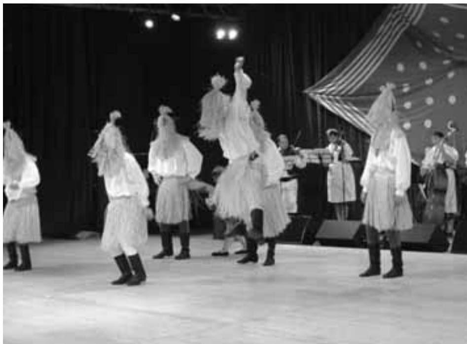
Slamáci Podjavořičanu z pásma Masopust budili v Belgii zaslouženou pozornost.