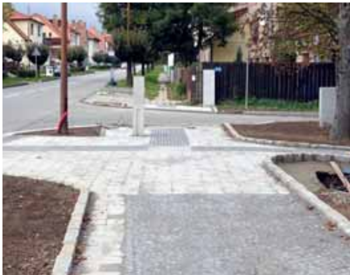
SLOUPEK, KTERÝ ZMÍZÍ. Opravdu jste si mysleli, že sloupek v chodníku zůstane? Bez něj by teď nesvitila Hradecká ulice. Zmizí současně s rozsvícením nových světel na autobusovém zálivu.