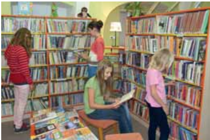
Městská knihovna má nové vybavení dětského oddělení.