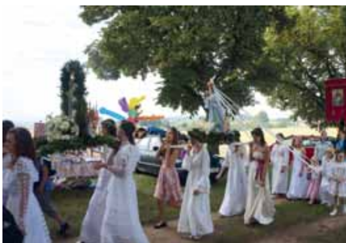
DRUŽIČKY. V procesí na Humberk u Krasonic.