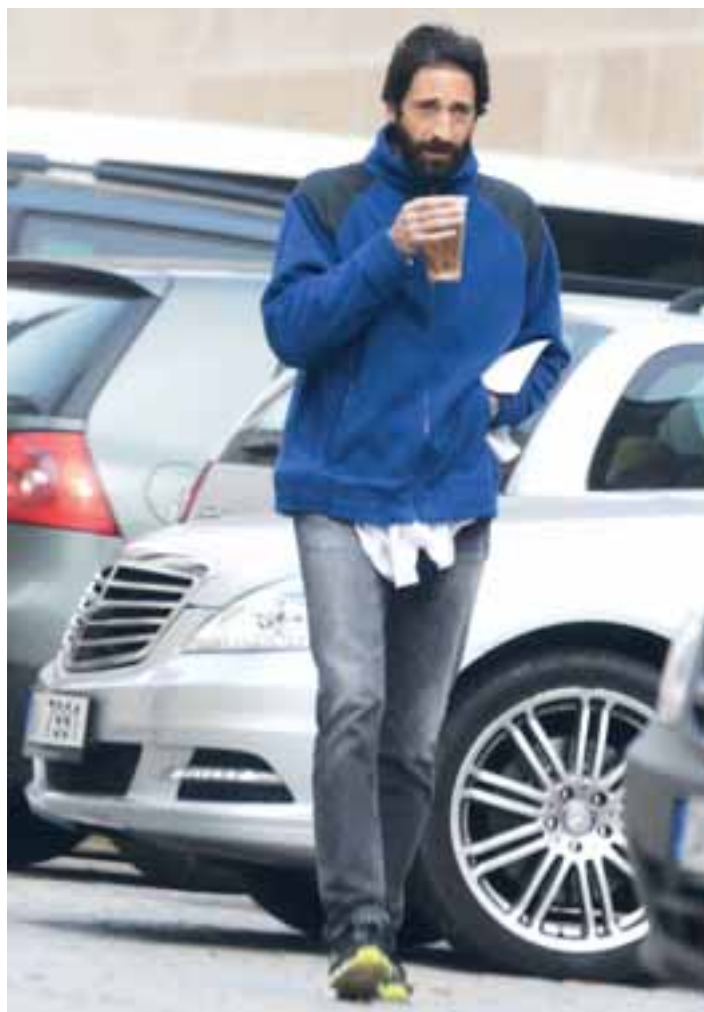
FILMOVOU HVĚZDU. Amerického herce Adriana Brodyho. Více na str. 11.