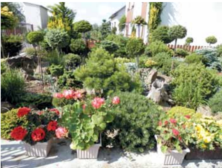
BOTANICKÁ ZAHRADA? Ne. Oceněné prostranství před domem paní Jany Irhové. Kde? Příznačně v Květinové ulici. Výhodnocení soutěže o květinovou výzdobu na str. 18.