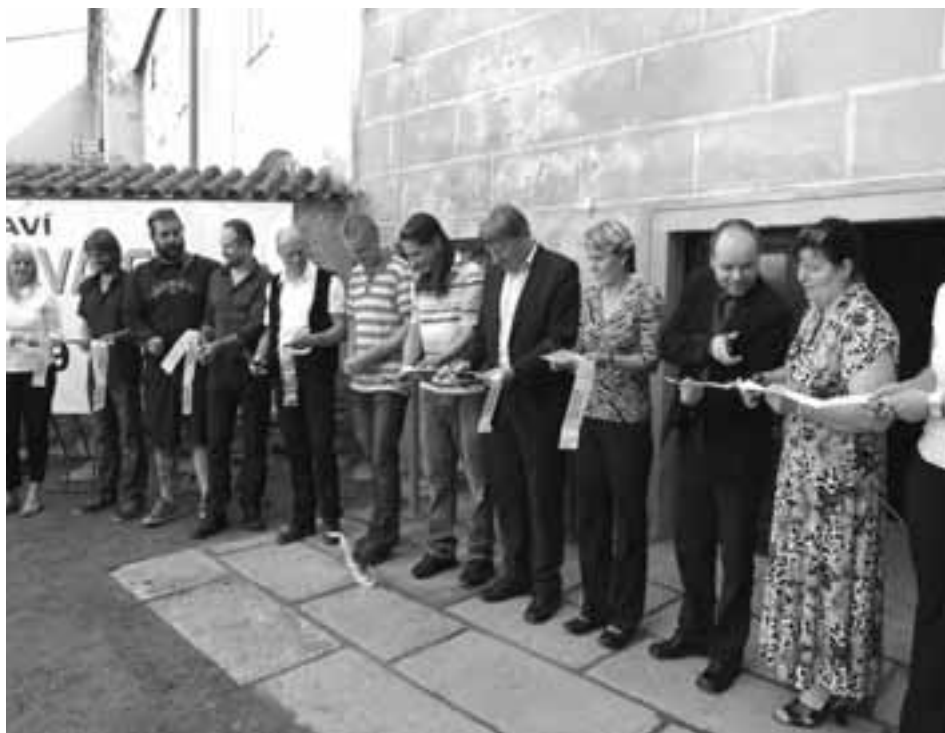
PÁSKA BYLA KRÁTKÁ. 5. září při slavnostním otevření podzemí.