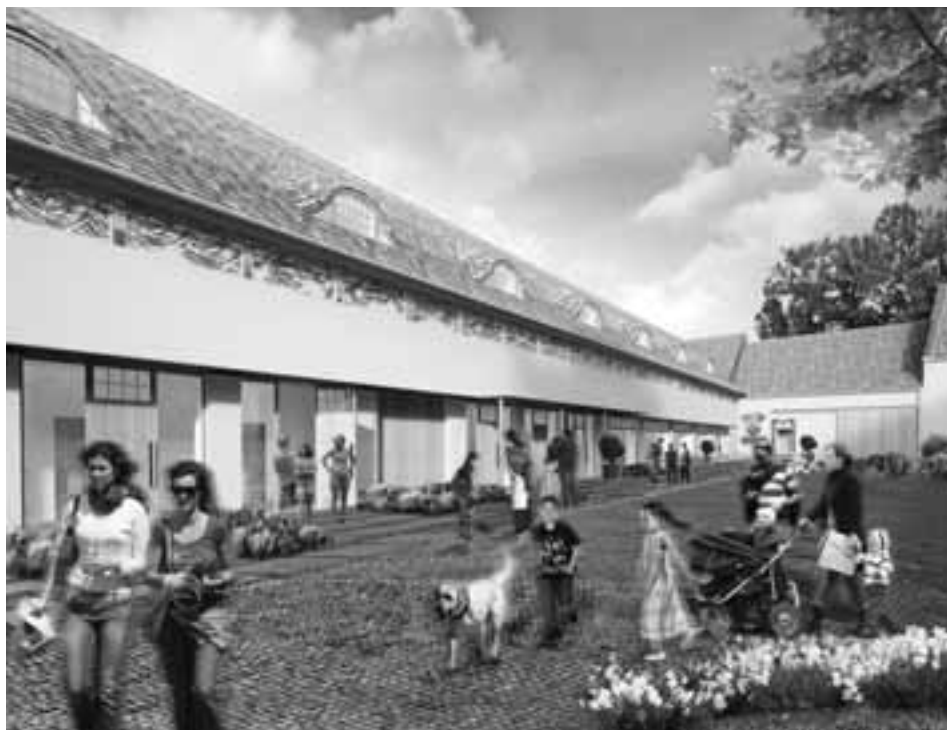
Budoucí podoba Panského dvora. Dočkáme se jí již v roce 2015.

Vizualizace: Architekti Hrůša & spol., Ateliér Brno, s.r.o.