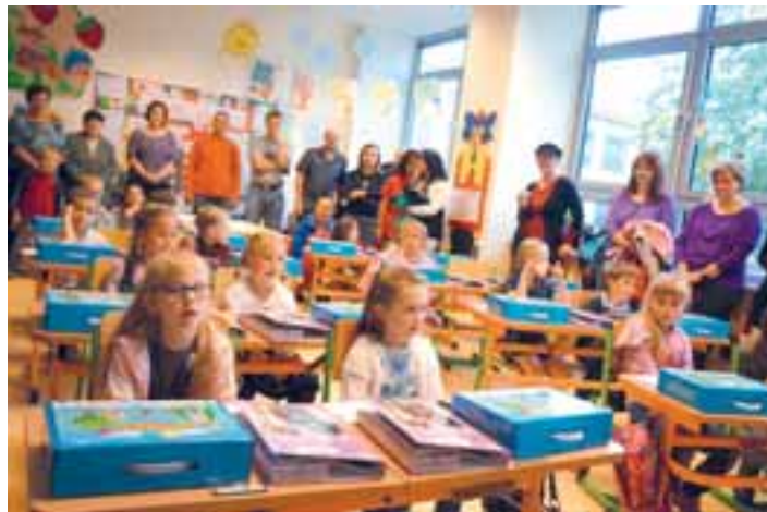
88 prvňáčků nastoupilo 1. září do telčských škol.