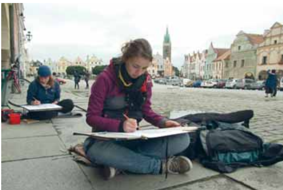
Plenér po turecku.