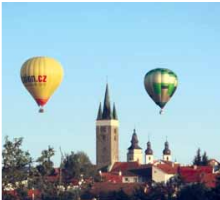
BALÓNY. Ve vzduchu.