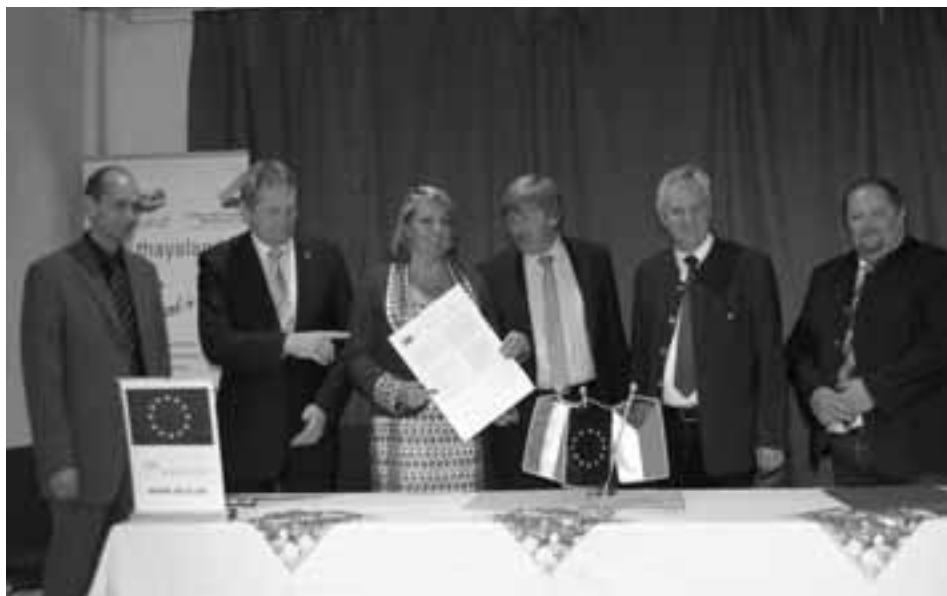
MĚL BY FRANTIŠEK JOSEF RADOST? Region Zukunftsraum Thayaland se stal členem Regionu Renaissance.

V neděli 14. září se v galerii Lindenhof v rakouském Raabsu an der Thaya sešli zástupci mikroregionů Třeštsko, Telčsko, Dačicko a Jemnicko s představiteli regionu Zukunftsraum Thayaland. Setkání se uskutečnilo v rámci projektu Cestujeme po Regionu Renaissance. Na závěr setkání pak společně podepsali memorandum o přistoupení regionu Zukunftsraum Thayaland do Regionu Renaissance. Podle TZ