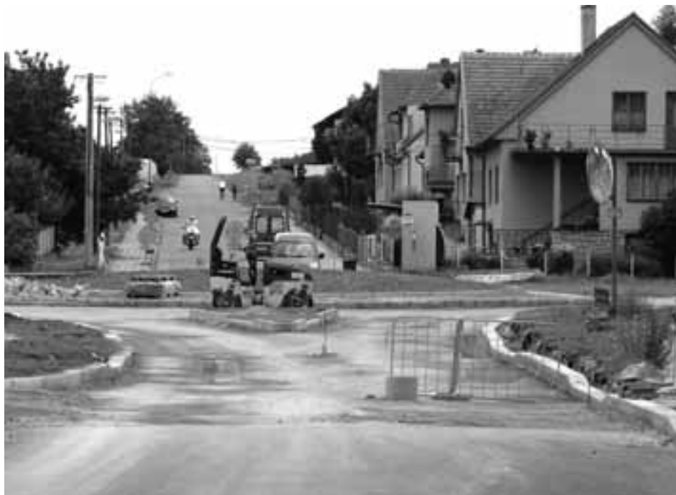
I stavba druhého kruhového objezdu již finišuje.

ně v provozu. Pak přijde na řadu dopravní značení a dokončovací práce v okolí vozovky. Vše by se mělo zvládnout tak, aby se ulicí 9. května a oběma kruhovými objezdy na konci srpna jezdilo.