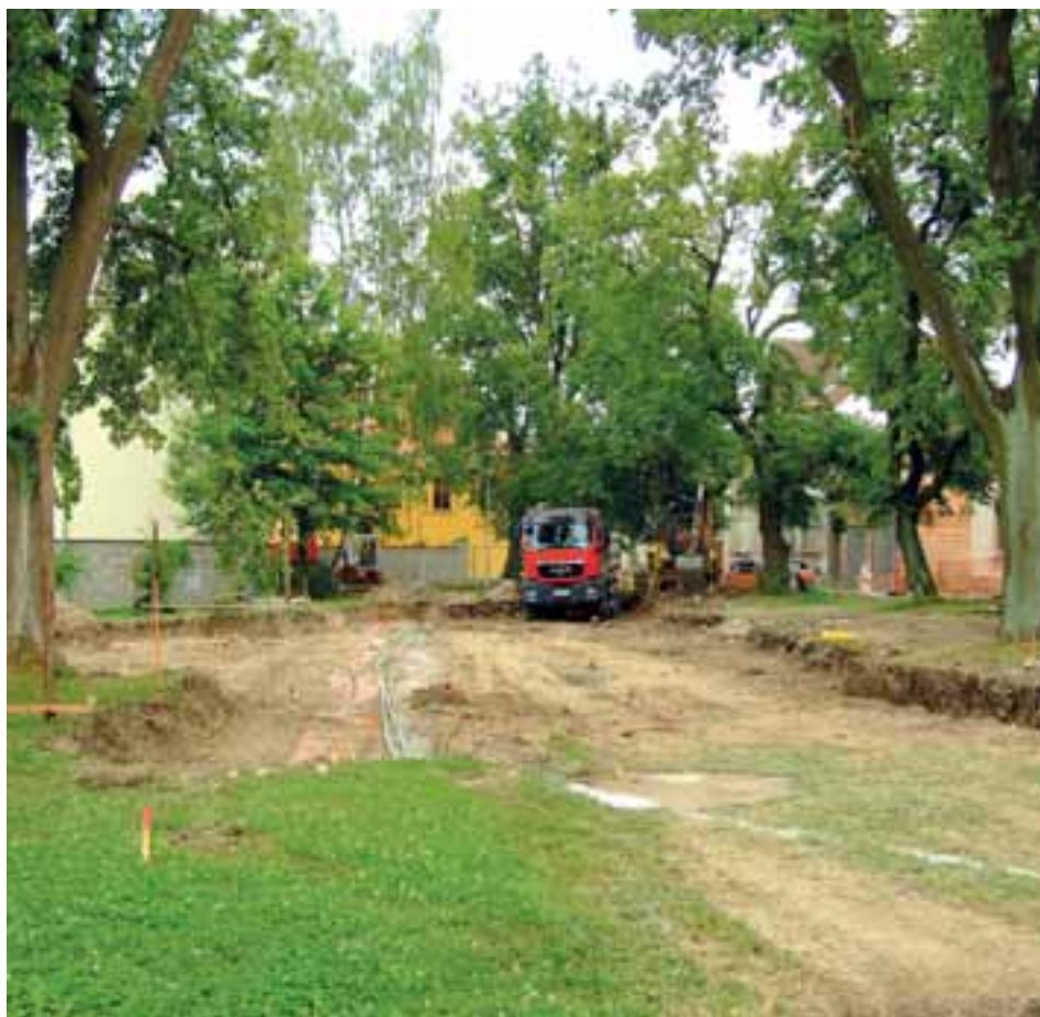
Zahájení prací na dopravním terminálu u areálu škol v Hradecké ulici.