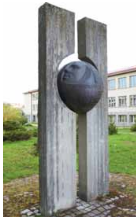
Dočasné stěhování pomníku Jurije Gagarina bohužel neviděly.